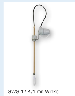
GWG 12 K/1 mit Winkel

Anwendung Einsatz als Teil einer Abfüllsicherung zur Vermeidung von Überfüllungen von Behältern. Für Batterietanks aus Stahlblech nach DIN 6620-1 Form B, standortgeschweißte Rechtecktanks nach DIN 6625-1 in Bauhöhen 1 bis 4 m und für Kunststoff-Behälter, auch in Batterieaufstellung (bis zu 25 Einzelbehälter). Geeignet für den Einsatz in hochwassergefährdeten Gebieten.