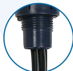
Abbildung: Euroflex 3 mit Schwimmer

Armatur aus hochfestem, witterungsbeständigem Kunststoff. Zugelassen als Isoliertrennstück.